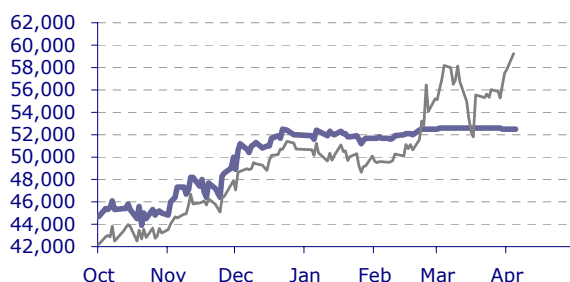
11年1Q国産ナフサ予想値および評価値(円/KL)